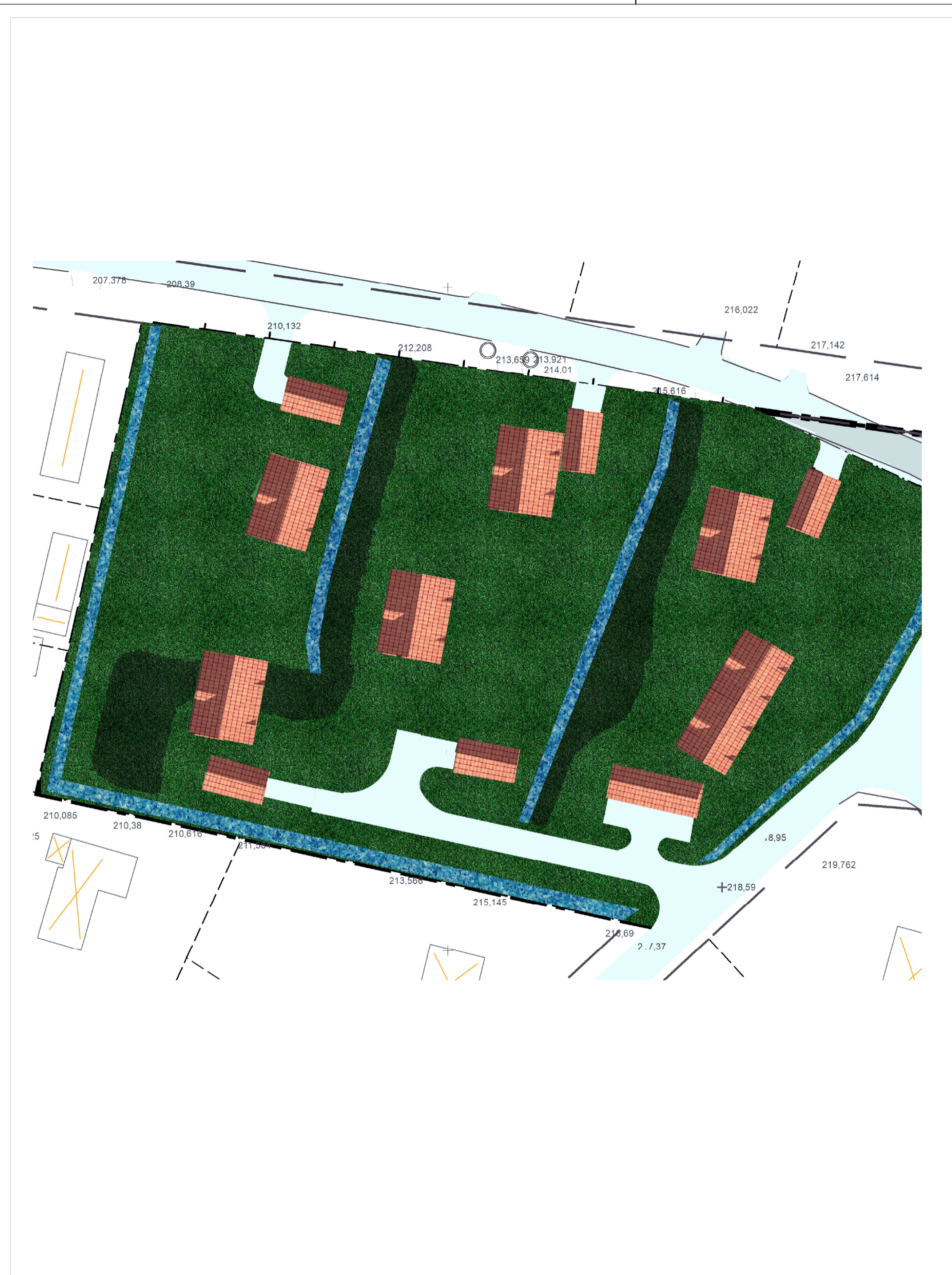
ILLUSTRATION Illustrationen visar ett exempel på hur planområdet kan bebyggas.